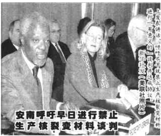
安南呼吁早日进行禁止生产核裂变材料谈判