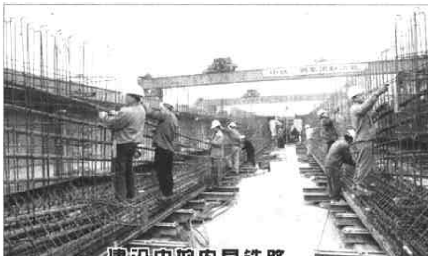
国家重点建设工程——内昆铁路正在加紧建设中,其中的安边段起于内(江)宜(宾)线安边站,止于贵昆线梅花山站,全长约370公里,建成后对缓解西南运输紧张状况、加快山区农民脱贫有重要作用。这是中铁二局新运处内昆铁路制梁场的工人正在扎制桥梁钢筋。

一同走过20世纪风风雨雨的三位耄耋老友相约新世纪,真是文坛间特有的称呼)你今年90